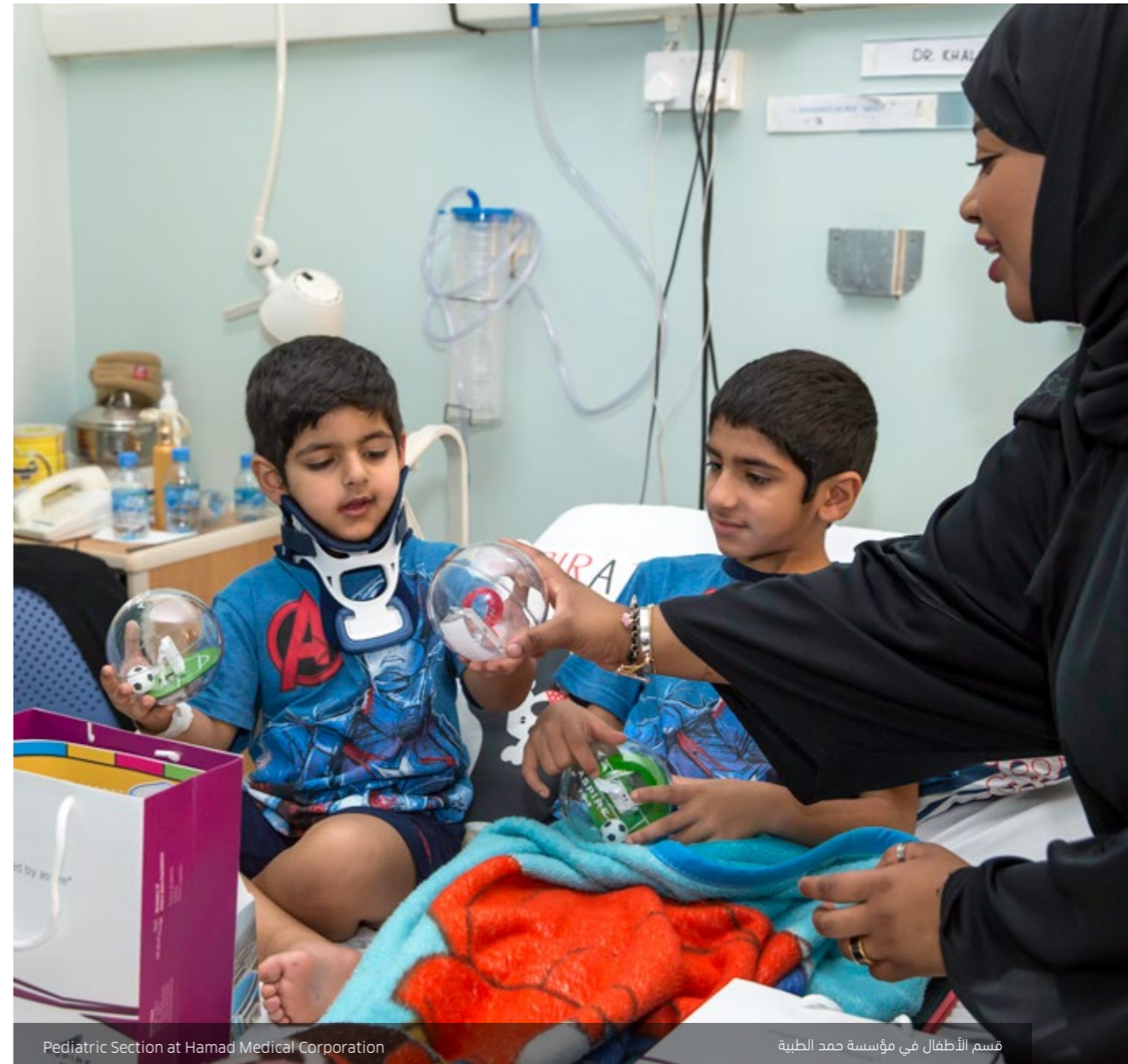
Pediatric Section at Hamad Medical Corporation