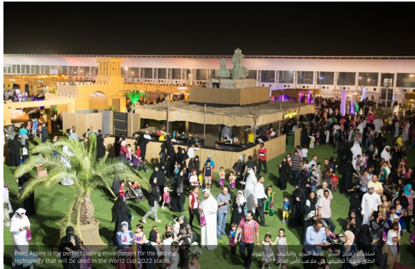
Freej Aspire is the perfect testing environment for the cooling technology that will be used in the World Cup 2022 stadia.