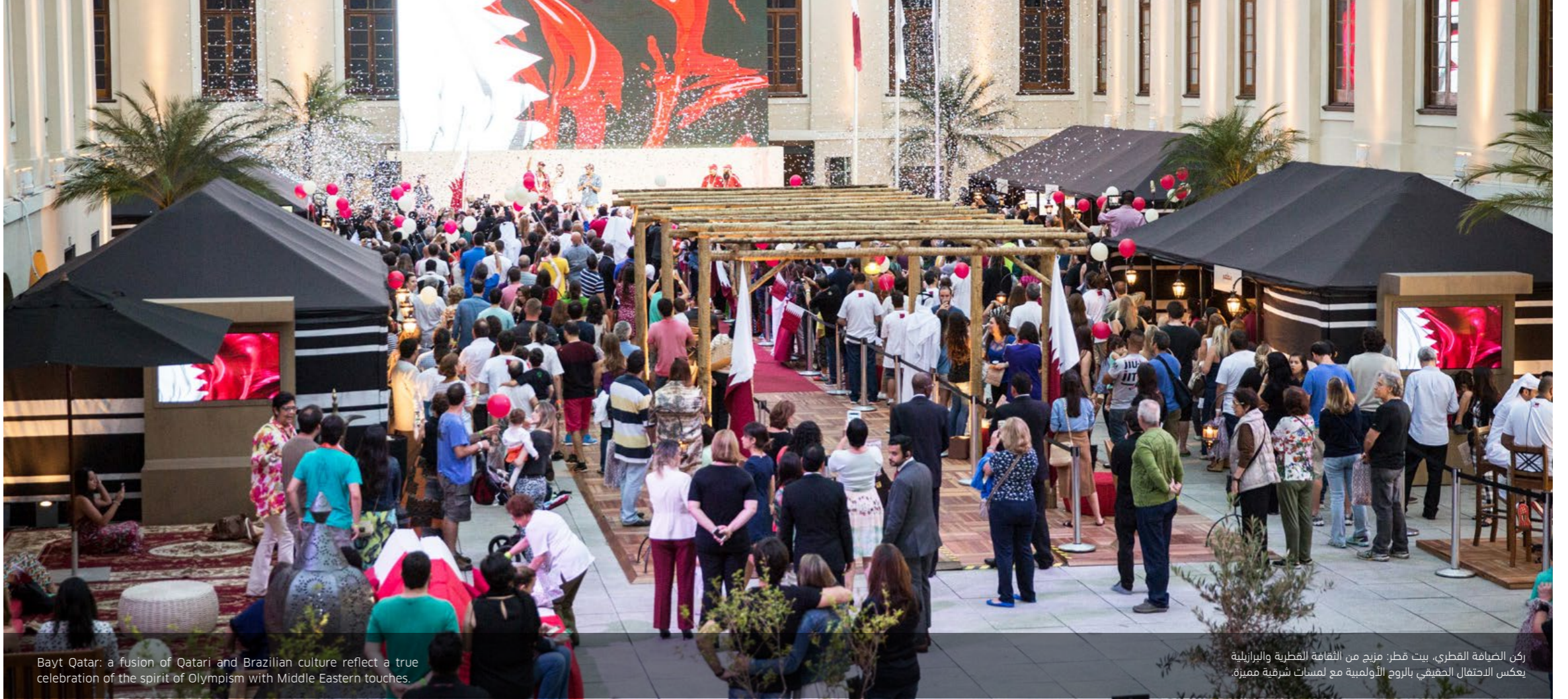
Bayt Qatar: a fusion of Qatari and Brazilian culture reflect a true celebration of the spirit of Olympism with Middle Eastern touches.

Zico , the Brazilian coach and former footballer, recalled his memories in Aspire Zone during his visit to Bayt Qatar. He still remembers how impressive, excellent and world-class Aspire's facilities are.