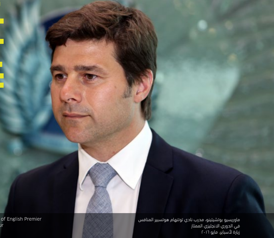
Mauricio Pochettino, Manager of English Premier League side Tottenham Hotspur Visit to Aspire, May 2016