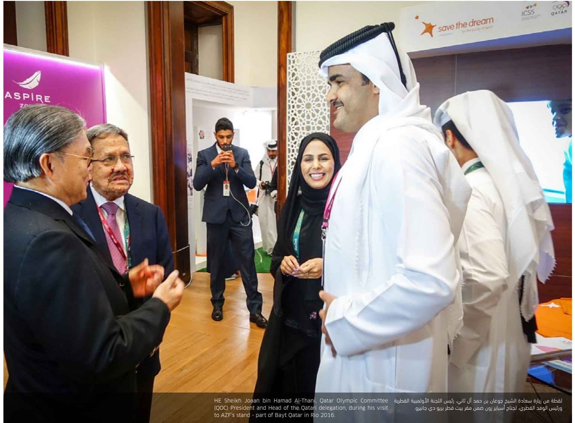
لقطة من زيارة سعادة الشيخ جوعان بن حمد آل ثاني، رئيس اللجنة الأولمبية القطرية ورئيس الوفد القطري، لجناح أسباير زون ضمن مقر بيت قطر بيو دي جانيرو. HE Sheikh Joaan bin Hamad Al-Thani, Qatar Olympic Committee (QOC) President and Head of the Qatari delegation, during his visit to AZF's stand - part of Bayt Qatar in Rio 2016.

At the sidelines of the Games, Bayt Qatar, QOC's hospitality house, welcomed guests and visitors with a unique fusion of Qatari and Brazilian culture reflecting the spirit of Olympism with Middle Eastern touches in a true celebration of life.