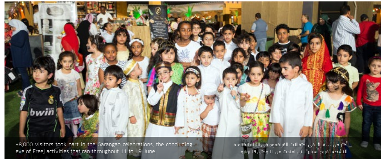
+8,000 visitors took part in the Garangao celebrations, the concluding eve of Freej activities that ran throughout 11 to 19 June.