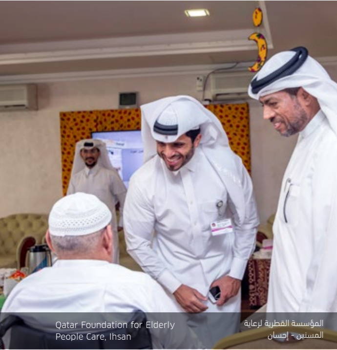
Qatar Foundation for Elderly People Care, Ihsan

نظمت مؤسسة أسبائير زون في رمضان سلسلة من الزيارات إلى بعض المؤسسات المحلية الرائدة، ضمن برنامج المسؤولية الاجتماعية. شملت هذه الزيارات: