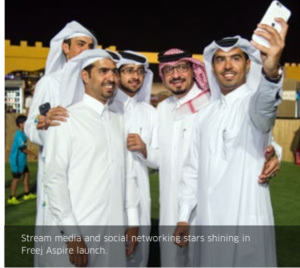
Stream media and social networking stars shining in Freej Aspire launch.