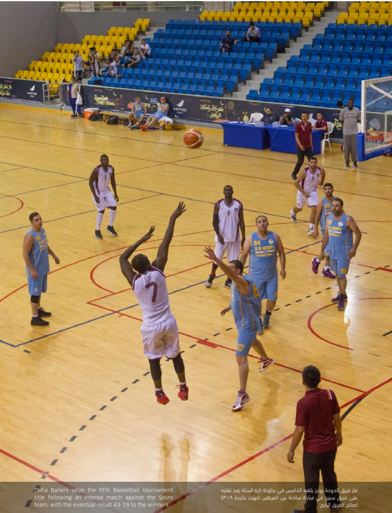
Doha Ballers seize the fifth Basketball tournament title following an intense match against the Spurs team, with the eventual result 43-19 to the winners.