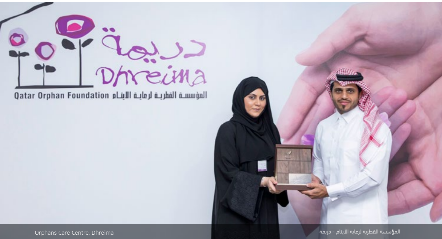
Orphans Care Centre, Dhreima