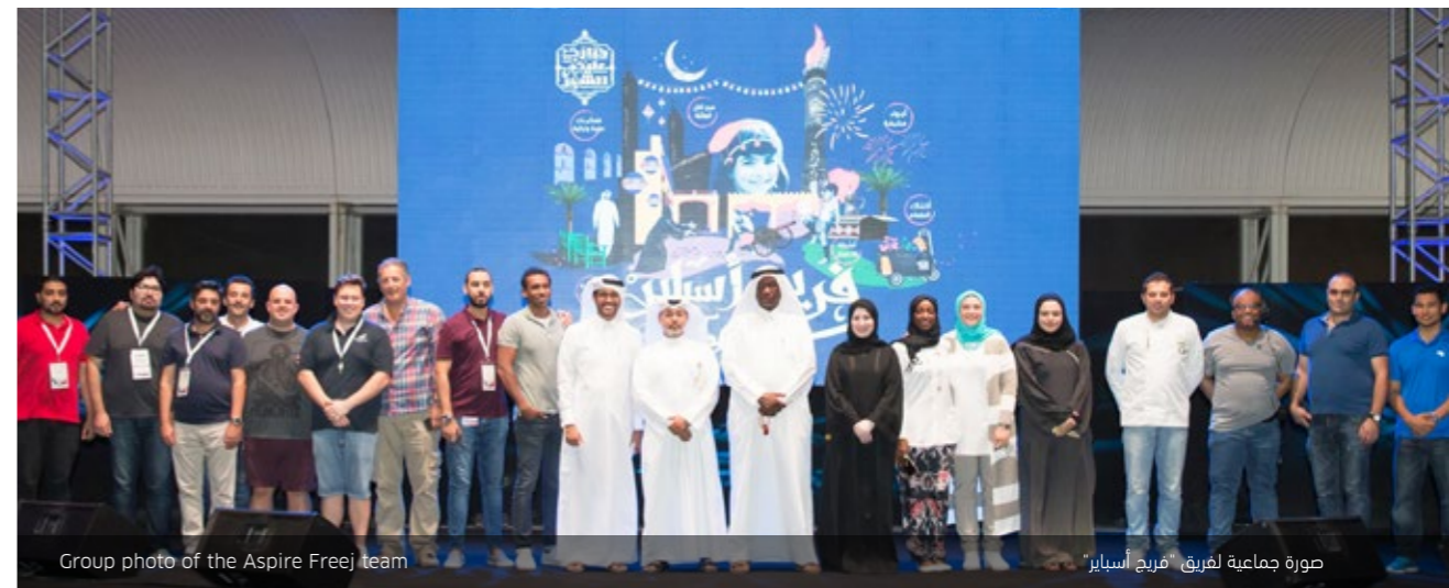
Group photo of the Aspire Freej team