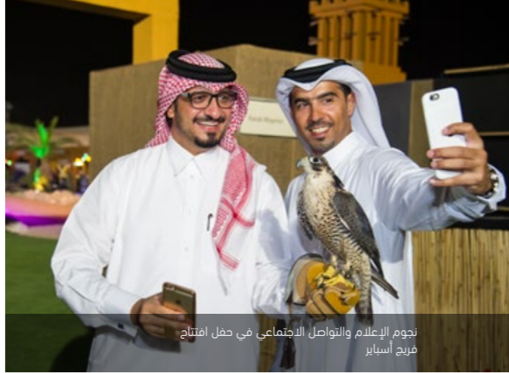
نجوم الإعلام والتواصل الاجتماعي في حفل افتتاح فريج أسباير