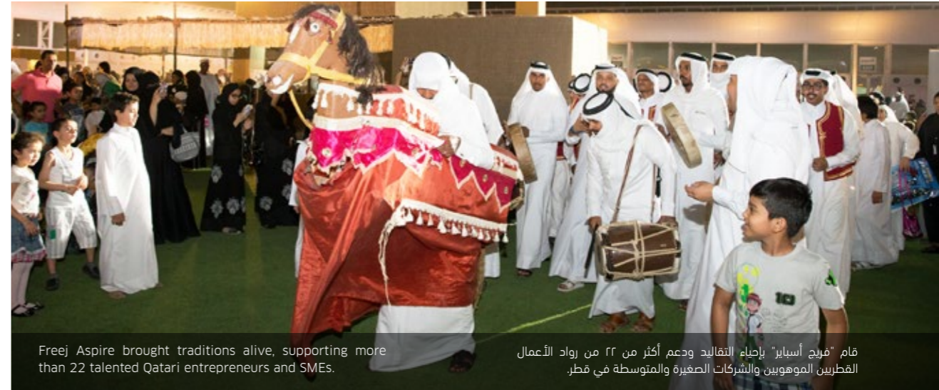
Freej Aspire brought traditions alive, supporting more than 22 talented Qatari entrepreneurs and SMEs.