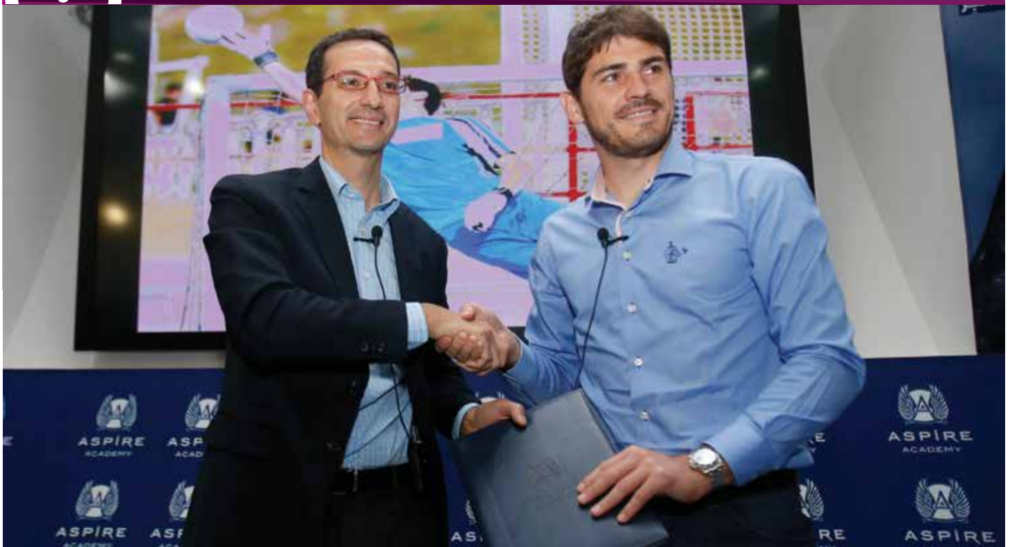
Aspire Academy joined forces with Iker Casillas Foundation to create the most ambitious project to date: training for goalkeepers on human values and leadership.