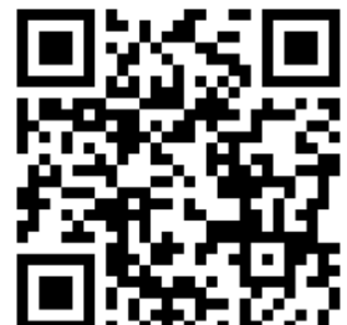
Follow us on instagram