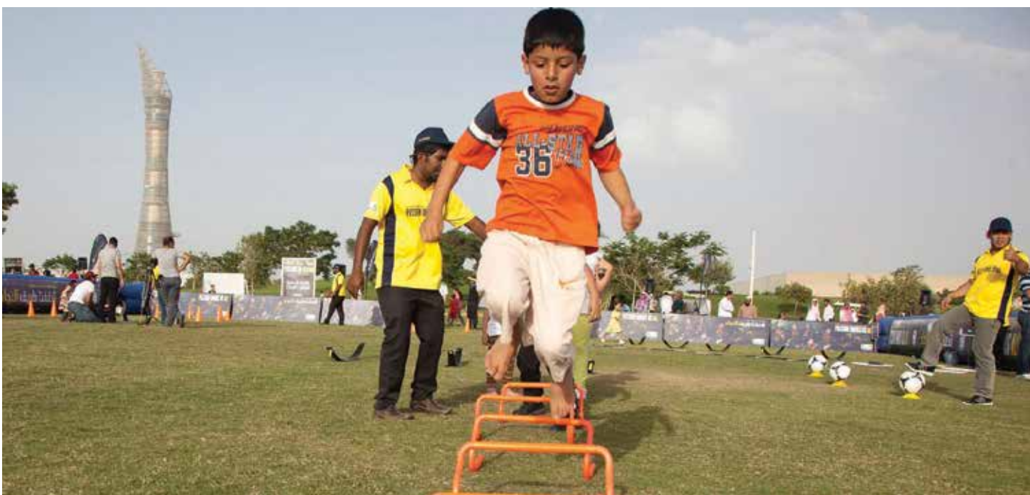
Aspire Park, one of the venues hosting the Qatar Foundation for Education, Science and Community Development's Passport to Passion challenge in May. Children aged between 5 and 15 took part in a series of tests designed to improve footballing skills.