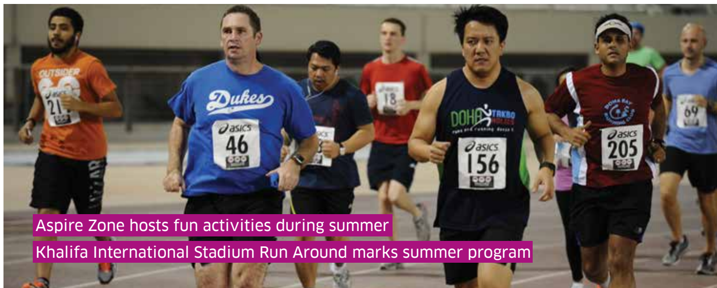
Aspire Zone hosts fun activities during summer Khalifa International Stadium Run Around marks summer program

As part of its commitment to the promotion of active lifestyles, Aspire Zone Foundation organized a multitude of fun activities designed to help members of the community stay fit throughout the hot summer months.