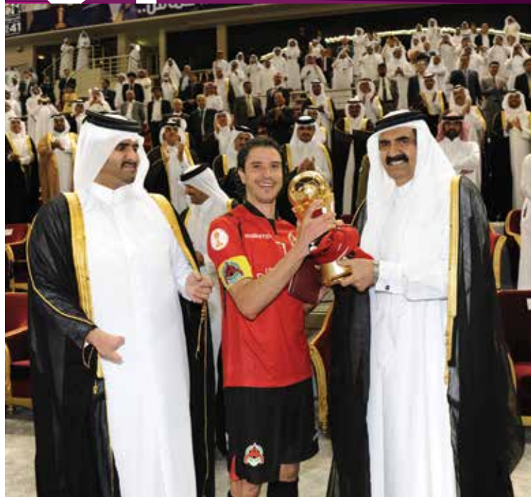
Photo Emir Cup