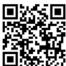
Follow us on Instagram

The Gartner CIO Summit was held for the first time in the region.