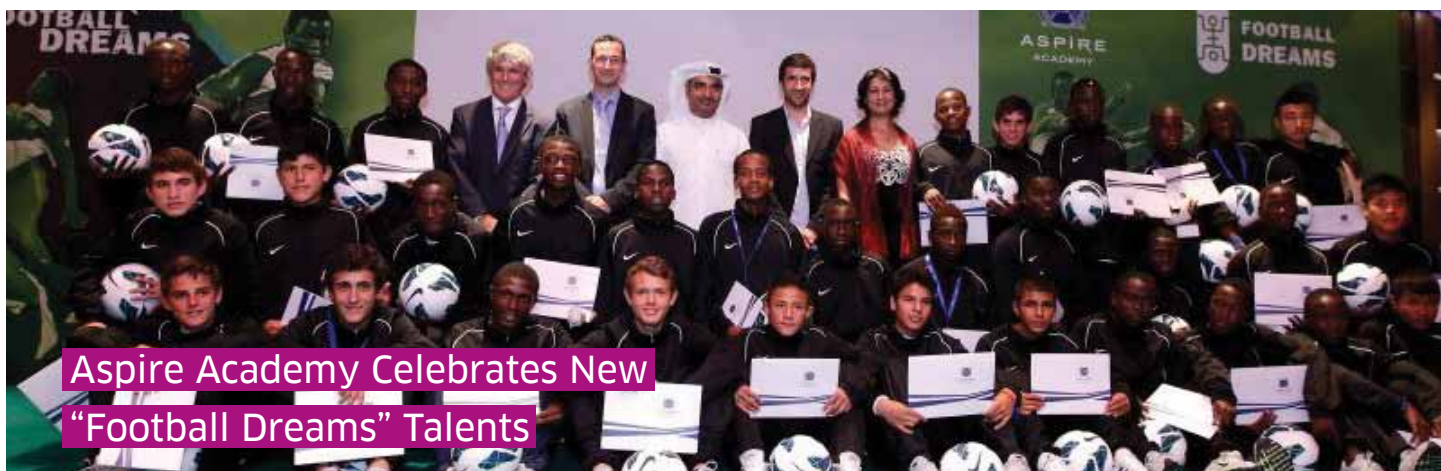
Aspire Academy Celebrates New “Football Dreams” Talents

Aspetar aims through the Scientific Advisory Board to further knowledge and experience in the field of research and clinical education in order to meet its vision to be a leader in the field of sports medicine by 2015.