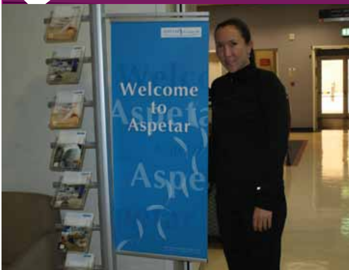
Jelena Jankovic, a professional tennis player from Serbia and former World No. 1, during her visit to Aspitar.

لاعبة التنس الصربية يلينا يانكوفيتش، التي تصدرت الترتيب العالمي للاعبات التنس سابقا، أثناء زيارتها لسبيتار.