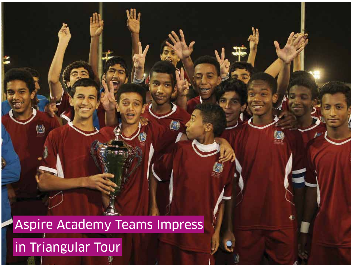
Aspire Academy Teams Impress in Triangular Tour

A total of 11 countries from around the world competed in the Bahrain Open, which ran over a period of five days.