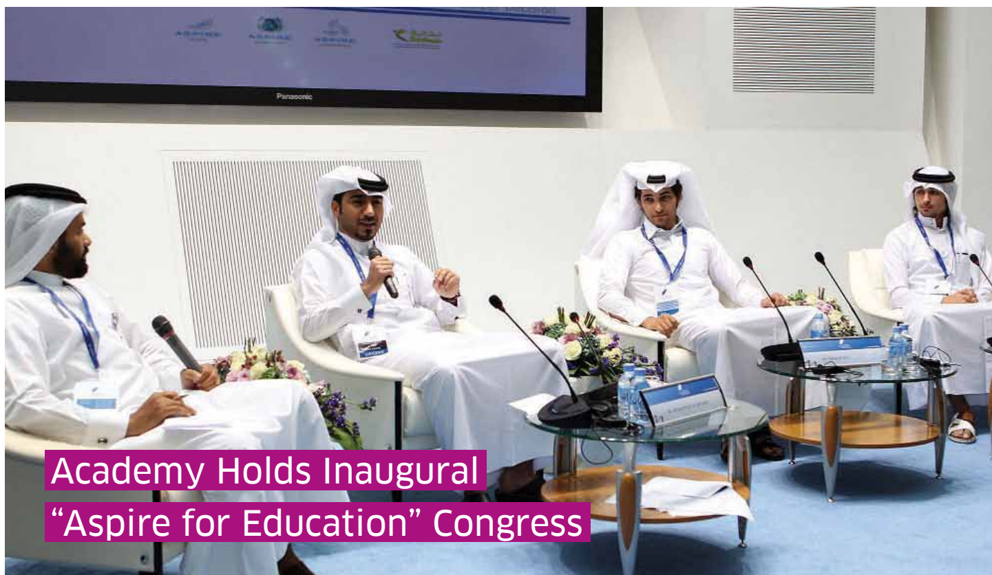
Academy Holds Inaugural "Aspire for Education" Congress

SUCCESSFULLY HIGHLIGHTS CONTEMPORARY ISSUES OF EDUCATION AND THE THEMES SURROUNDING THE INDUSTRY